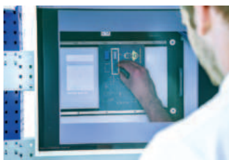
«Der Schlaue Klaus» ist ein kamerabasiertes Werkerassistenzsystem zur Digitalisierung manueller Prozesse.

zesse zu minimieren und ein gesundes Arbeiten zu fördern.