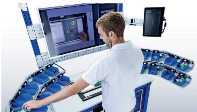
Schritt-für-Schritt Anleitung des Werkers am Bildschirm.

Die Digitalisierung kommt immer mehr auch beim Werker an. Nun zeigt ein kognitives und kamerabasiertes Assistenzsystem, wie die Schnittstelle zwischen Mensch und Maschine optimal gelingen kann. Ob Warenein- und -ausgang oder Kommissionierung, ob Montage/Demontage oder Endkontrolle: «Der Schlaue Klaus» unterstützt manuelle Arbeitsprozesse. In Kombination mit einem ergonomischen Arbeitsplatz werden so maximale Produktivität, Effizienz und Flexibilität erreicht.