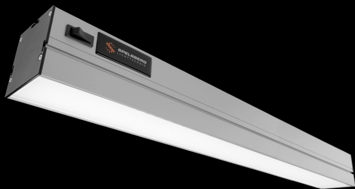
Abbildung: APL-Universal-I A 900 basic

LED Arbeitsplatz-, Maschinen- und Anlagenleuchte | 600 - 1.500 mm